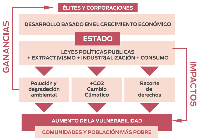
Figura 2 | Enfoque de Justicia Climática